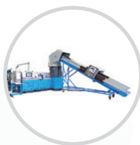
Линии по переработке