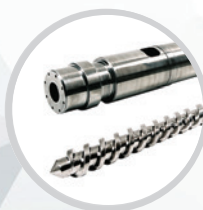
Шнеки и цилиндры