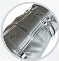
Термоизоляционные чехлы для машин