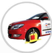
Блокираторы колес автомобиля